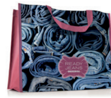
MO4070 Horizontální nákupní taška.