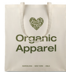
Organic Cottonel MO8973

Nákupní taška z organické bavlny s dlouhými uchy, 105 gr/m 2 . Vyrobeno z organické bavlny pod certifikovaným dohledem.