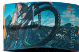
MH3101 MH3101 100% RPET (140 g/m2). Velikost 25x11cm.