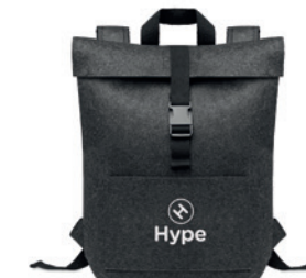
Indico Pack MO6456

Cestovní organizér z plsti RPET se 2 vnitřními a 4 vnějšími přihrádkami.