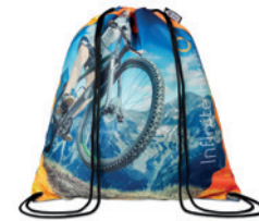
MB3111 Stahovací batoh ze 100% RPET.