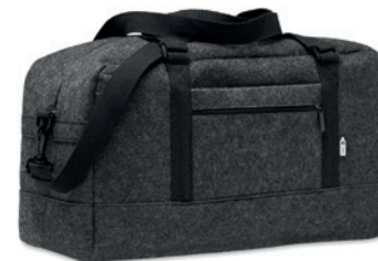
Indico Bag MO6457

Plstěný RPET stahovací batoh s polyesterovými šňůrkami.