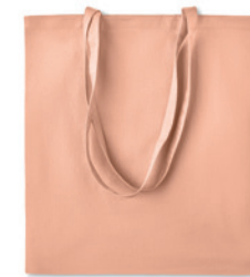
Zimde Colour MO6189

Nákupní taška z organické 140 gr m 2 bavlny s dlouhými držadly. Vyrobeno podle certifikované normy pro používání škodlivých látek v textilu.