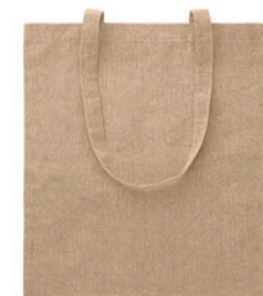
Cottonel Duo MO9424

Nákupní taška z 50 % recyklované džínoviny a 50 % bavlny s dlouhými uchy. Látká 250 g/m 2 .