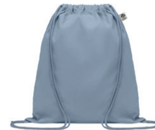
Yuki Colour MO6355

Střední sáček na skladování potravin z organické bavlny, 140 gr/m 2 .