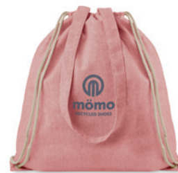
Moira Duo MO9603

Nákupní batoh ze 100% recyklované tkaniny s dlouhými uchy a stahováním. 140 gr/m 2 . Tato položka se po otisku může zmenšit.