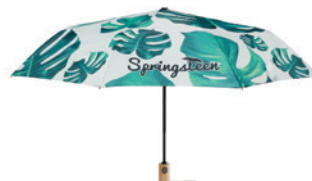
MU2006 MU2006 21" skládací deštník s dřevěnou rukojetí.