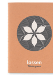
Mini Paper Book MO9868

Zápisník A5, desky z kartonu (250gr / m 2 ), vnitřek z recyklovaného 70g papíru (80 stránek).