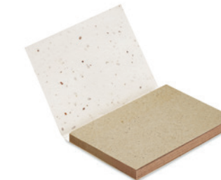
Grow Me MO6234

Bloček s měkkou obálkou, 25 listů. Tři barevné oddělovače. Obsahuje semena lučních květin, která vyrostou po zasadění do hlíny. Fabricat in UE.