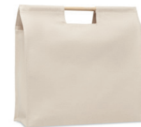
Mercado Top MO6458

Nákupní taška z organické 140 gr m 2 bavlny s dlouhými držadly. Vyrobeno podle certifikované normy pro používání škodlivých látek v textilu.