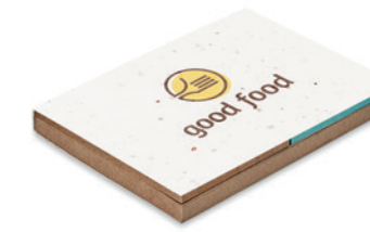
Grow Me MO6235

Zápisník s bambusovými deskami obsahující 70 recyklovaných stránek. Obsahuje ladící kuličkové pero z bambusu s koncovkou a klípek z ABS.