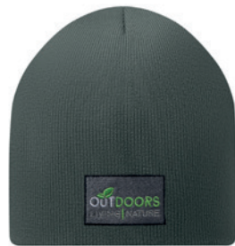
MW1101 MW1101 Dvouvrstvá čepice. 100% RPET. Univerzální velikost.