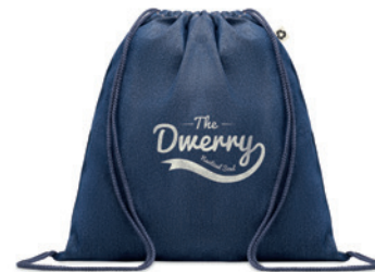
Style Bag MO6422

Nákupní batoh ze 100% recyklované tkaniny s dlouhými uchy a stahováním. 140 gr/m 2 . Tato položka se po otisku může zmenšit.