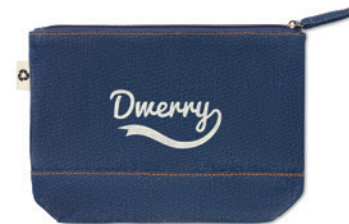
Style Pouch MO6421

Nákupní taška ze 100% recyklované tkaniny s dlouhými uchy. 140 gr/m 2 . Tato položka se po otisku může zmenšit.