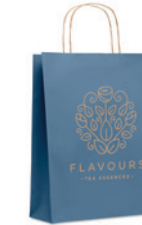
Paper Tone M MO6173

Zápisník A6, desky z kartonu (250gr / m 2 ), vnitřek z recyklovaného 70g papíru (80stránek).