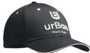
MH2103 MH2103 Čepice recyklované PET tkaniny a těžké bavlny se sendvičovým kšiltem.