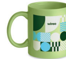
Dublin Tone MO6208

Keramický hrnek, samostatně zabaleny v dárkové krabičce z vlnité lepenky. Objem 300 ml.