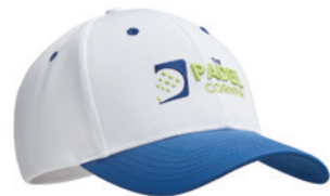
MH2101 MH2101 Čepice z recyklované PET tkaniny.