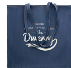
Style Tote MO6420

Stahovací batoh z 50 % recyklované džínoviny a 50 % bavlny. Látká 250 gr/m 2 .