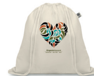
Organic Hundred MO8974

Stahovací batoh z bio bavlny, 140 gr/m 2 . Vyrobeno z certifikované organické bavlny.