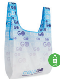
MB1111 Skládací nákupní taška ze 100% RPET s vnitřní kapsou. Rozměr: 41 x 63 cm.