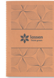
Mid Paper Book MO9867

Zápisník A5, desky z kartonu (250gr / m 2 ), vnitřek z recyklovaného 70g papíru (80 stránek).